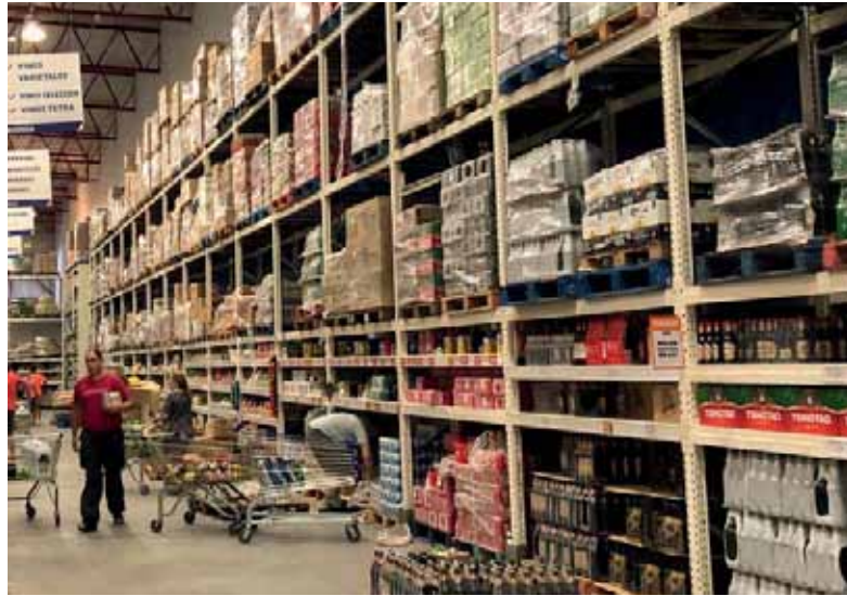
Para arriba. El sector de productos primarios fue uno de los motores de la suba mensual.

Dentro del mercado local, el sector de productos primarios fue uno de los motores de la suba mensual, destacándose el incremento del 2,8% en el IPP. En particular, los productos pesqueros