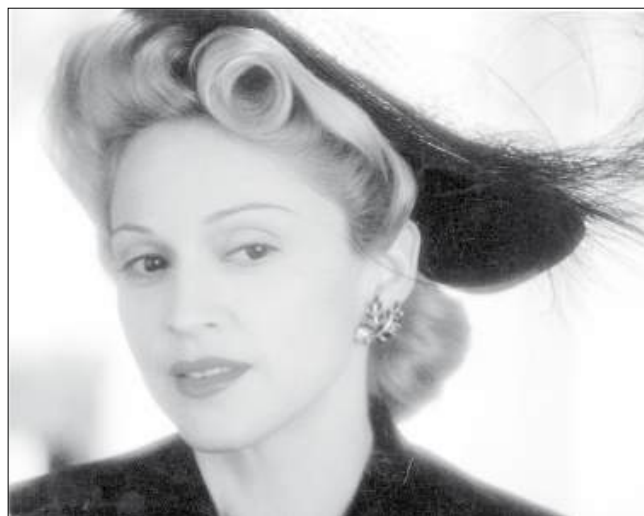
Madonna interpretando a Evita.

1942.- II Guerra Mundial: Altos dirigentes nazis deciden la "solución final del problema judío", en una reunión