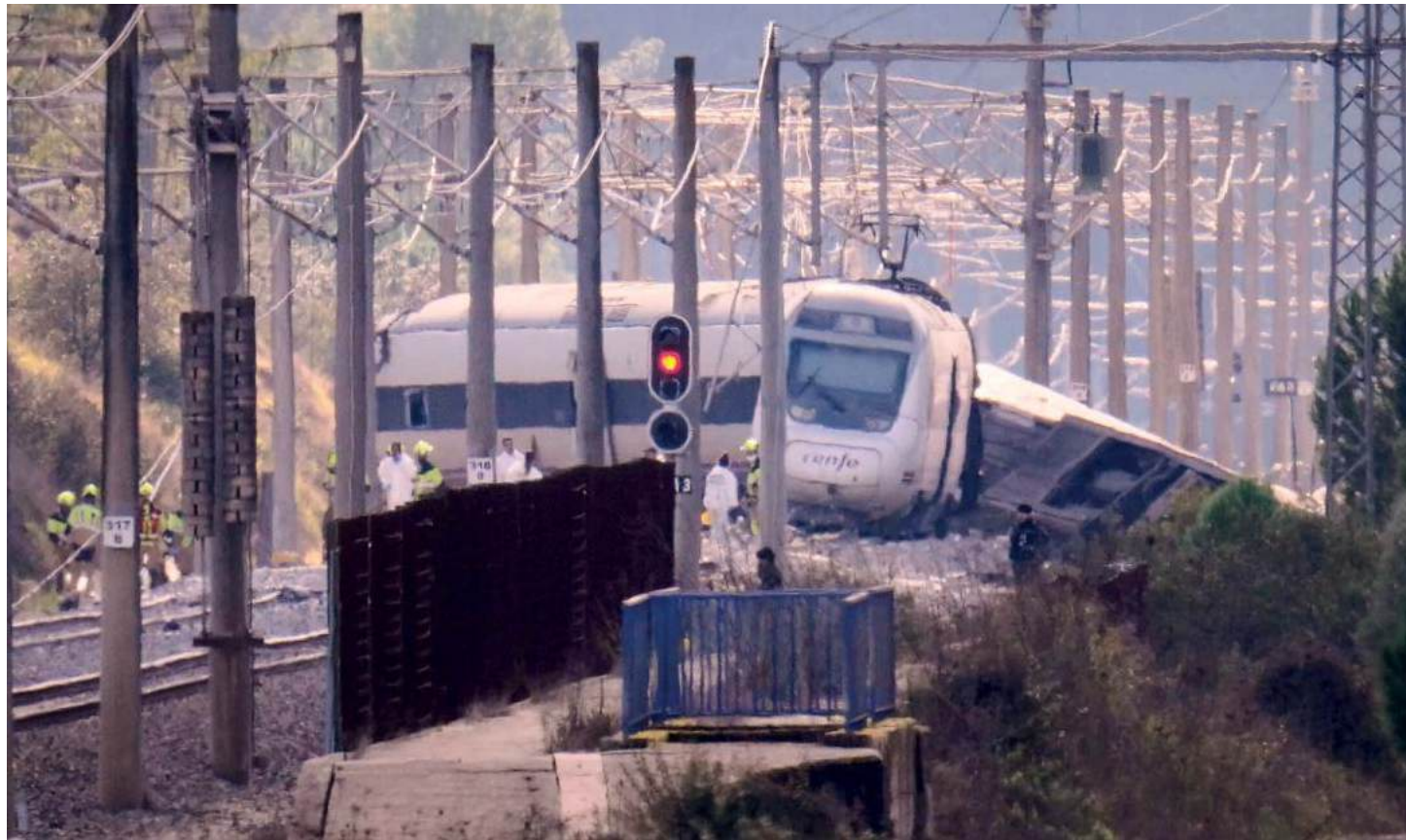
Una de las formaciones de alta velocidad descarriló y 20 segundos después impactó de frente contra el otro tren.

cional que subieron un 2,4%, mientras que los artículos importados mostraron un comportamiento más moderado, con un alza del 1,7%. Los productos pesqueros tuvieron un salto significativo del 10,7% en solo un mes. Página 2