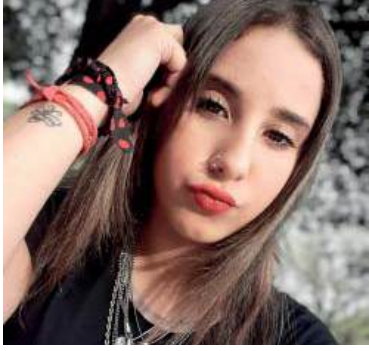
La adolescente fue asesinada en 2022.