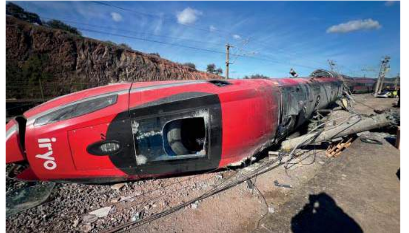
Cómo fue. Uno de los trenes de alta velocidad descarriló y 20 segundos después chocó de frente con la otra formación.

El presidente del Gobierno, Pedro Sánchez, visitó el lugar y aseguró que el Estado llegará "hasta