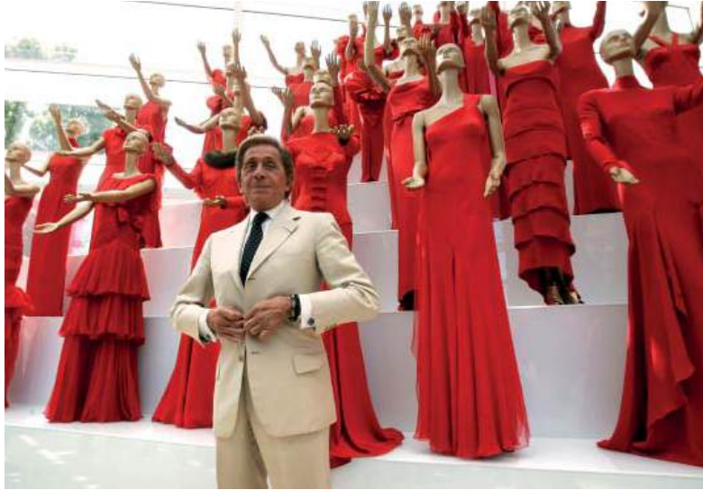
Su legado. El diseñador convirtió al "rojo Valentino" en un sello eterno de la moda mundial.

En 1960 se instaló definitivamente en Roma, en pleno auge de la "Dolce Vita". Allí abrió su primer atelier y comenzó una carrera fulgurante que lo llevó a vestir a las grandes divas de la época, como Elizabeth Taylor, Audrey Hepburn y Grace Kelly. Su consagración internacional llegó en 1968, cuando Jacqueline Kennedy eligió un vestido suyo para casarse con Aristóteles Onassis, un gesto que catapultó definitivamente a la marca