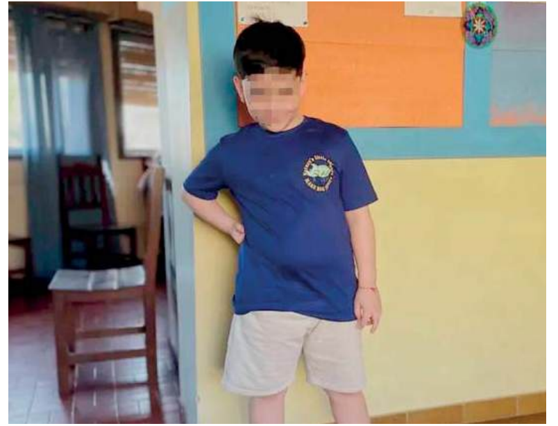
Preocupación. El menor de 8 años había mostrado avances en su recuperación, pero luego debió ser sometido a una nueva operación.

Una nueva jornada de verano en la costa atlántica se vio empañada por otro grave accidente