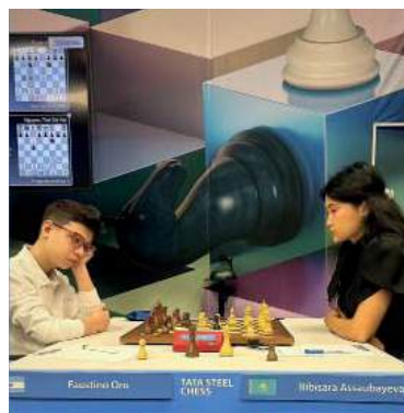
Solidez. Oro se afirma en el torneo.

El torneo, que reúne a 14 jugadores entre grandes maestros, maestros internacionales y talentos emergentes, representa para Oro no solo un desafío competitivo de primer nivel, sino también una valiosa oportunidad para seguir acumulando experiencia frente a rivales de alto Elo y consolidar su crecimiento en el ajedrez mundial.