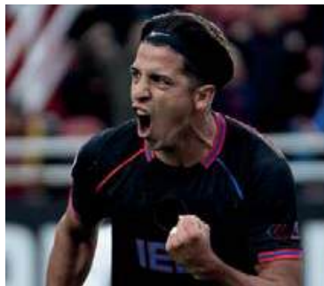
Firmeza. Cuello se quedaría.

Boca envió el sábado una propuesta formal para adquirir el 60 por ciento del pase de Cuello por 2,5 millones de dólares brutos, cifra que fue considerada insufi-