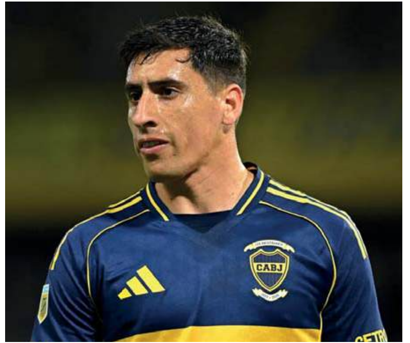
Ausencia. El uruguayo podría perderse hasta seis partidos.