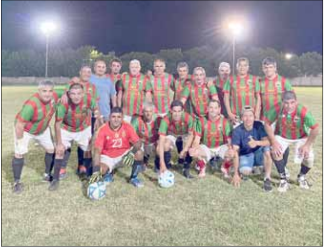
Panadería La Criolla, de Daireaux.