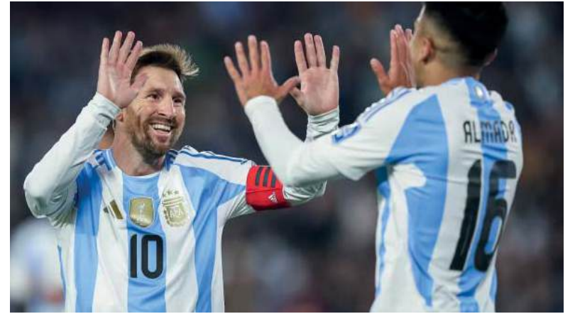
Televisación. Los partidos de la próxima copa del mundo se podrán ver por el canal estatal.

El jefe de Gabinete, Manuel Adorni, confirmó finalmente que los encuentros de Argentina serán transmitidos por TVP y Radio Nacional.