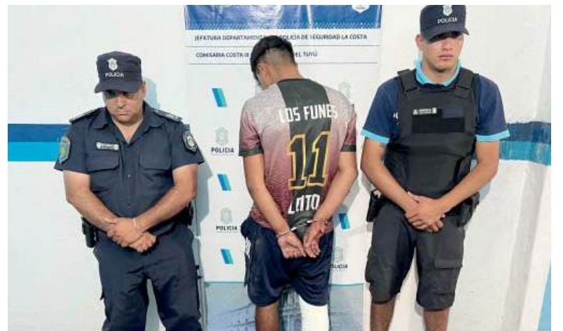
Capturado. El joven mayor de edad quedó detenido y se investiga su participación en otros robos en San Clemente.

“Este accionar refleja el compromiso institucional y el trabajo coordinado entre las fuerzas policiales, la Fiscalía, el Muni-